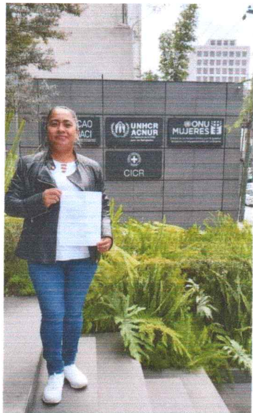
Visitamos las oficinas de OnuMujeresMéxico, en la Ciudad de México, para promover acciones de igualdad de género y empoderamiento de las mujeres en nuestro Municipio de Iguala, Guerrero.