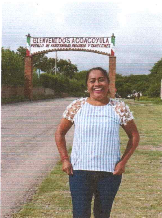
Este día realizamos un convivio por la celebración del adulto mayor con vecinos y comisarios de Coacoyula de Álvarez, al sur de nuestro municipio de Iguala, Guerrero.