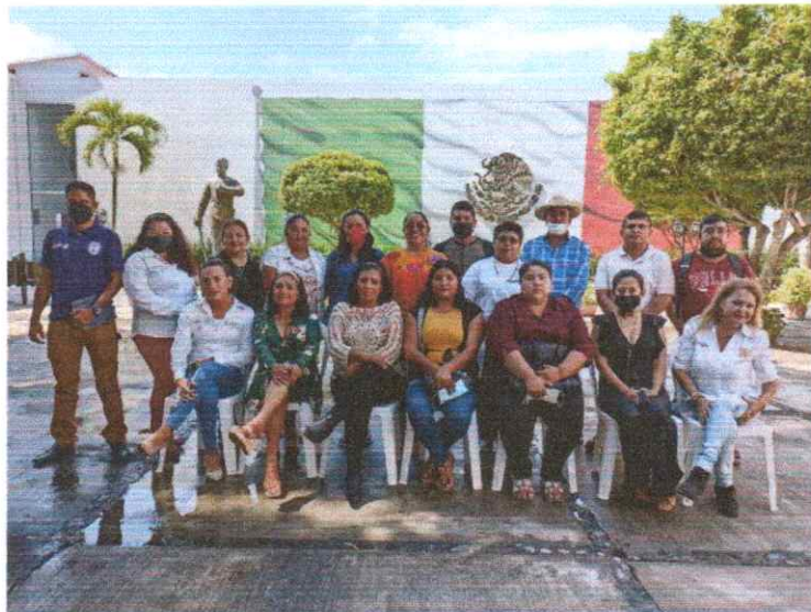
Reunión con los comisarios municipales de nuestro municipio para platicar temas de género y programas con perspectiva de género.