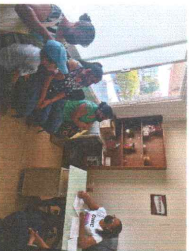
Atención a peticiones o trámites de ciudadanos del municipio.