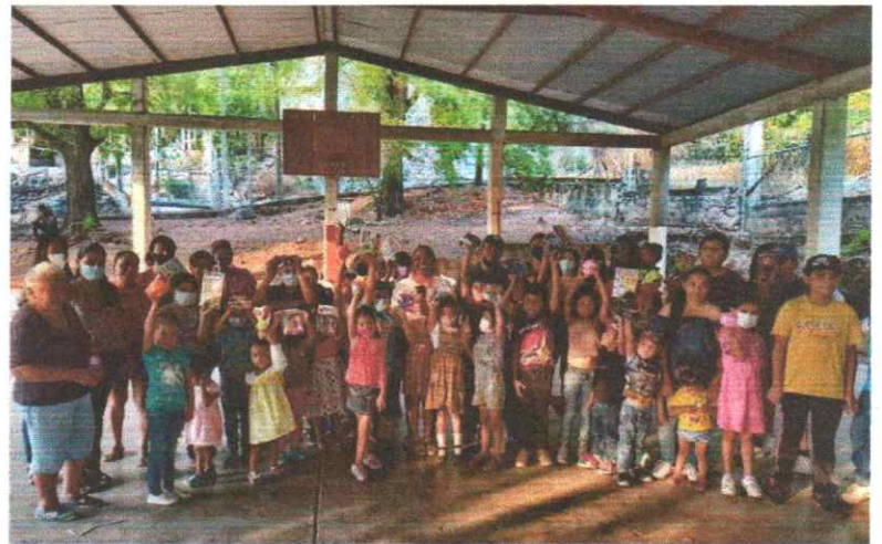
Ahora entregamos juguetes por el festejo del día del niño en la población de Platanillo, al norte de nuestro municipio de Iguala, Guerrero.