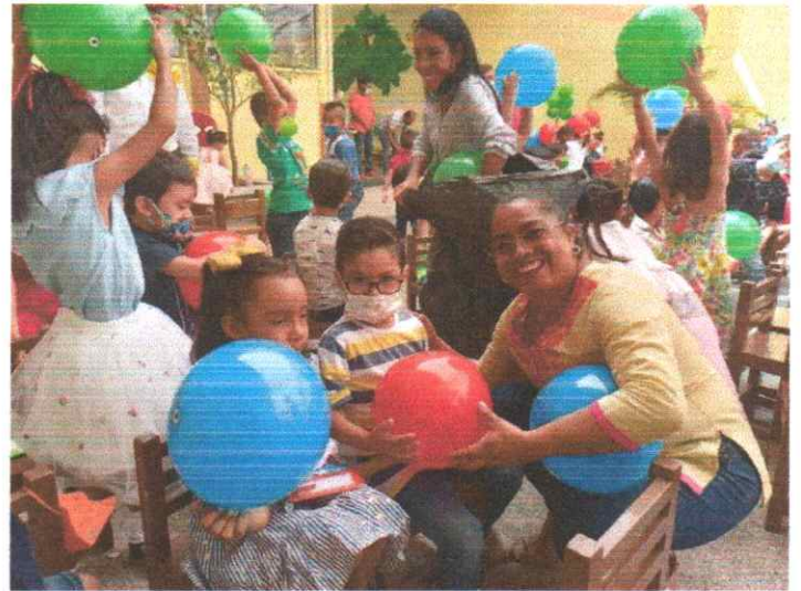
Festejó del día del niño, el jardín de niños casa Angela, centro de nuestra Ciudad de Iguala, Guerrero.