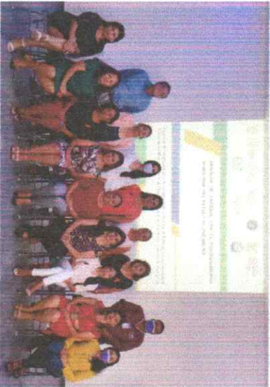
Mesa de trabajo del Sistema Municipal para Prevenir, Atender y Erradicar la Violencia contra las mujeres y niñas.