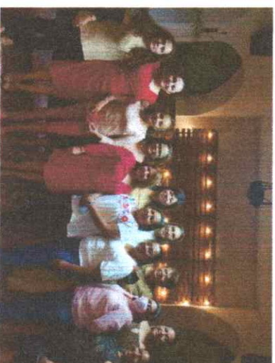
Reunión con la Red para el Avance Político de las Mujeres en la Región Norte A. C. Iguala, Guerrero.