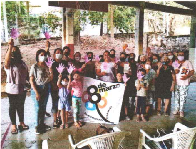
Conmemoración del día internacional de la mujer, con vecinas y niñas de Platanillo, al norte de nuestro municipio de Iguala, Guerrero.