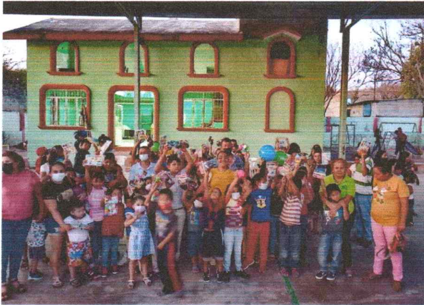
Festejamos y entregamos juguetes por el día del niño, en la población de Tepochica, al sur de nuestro municipio de Iguala, Guerrero.