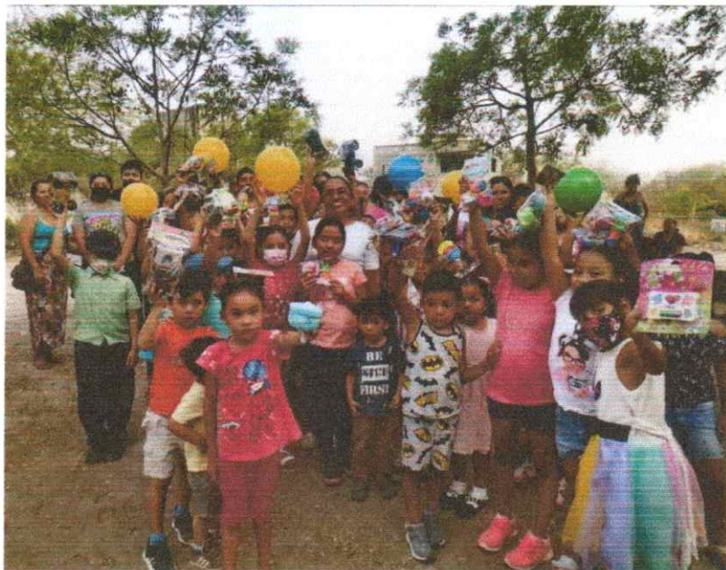
Ahora entregamos juguetes por el día del niño en la colonia Loma de coyotes, al poniente de nuestra Ciudad de Iguala, Guerrero.