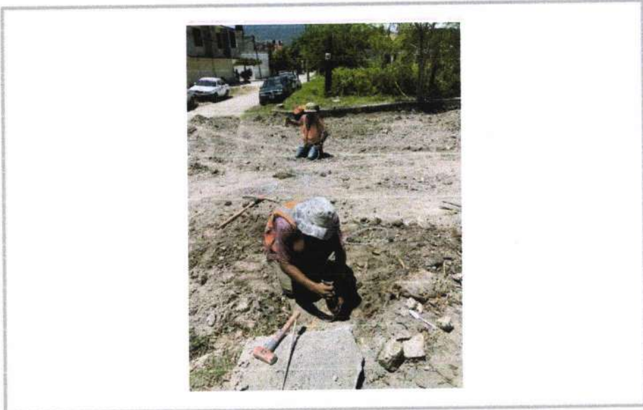
LIMPIEZA Y TRAZO EN EL AREA DE TRABAJO.

No. de CONTRATO: IGUALA/SDUOP/FISMDF/URB/2019-08