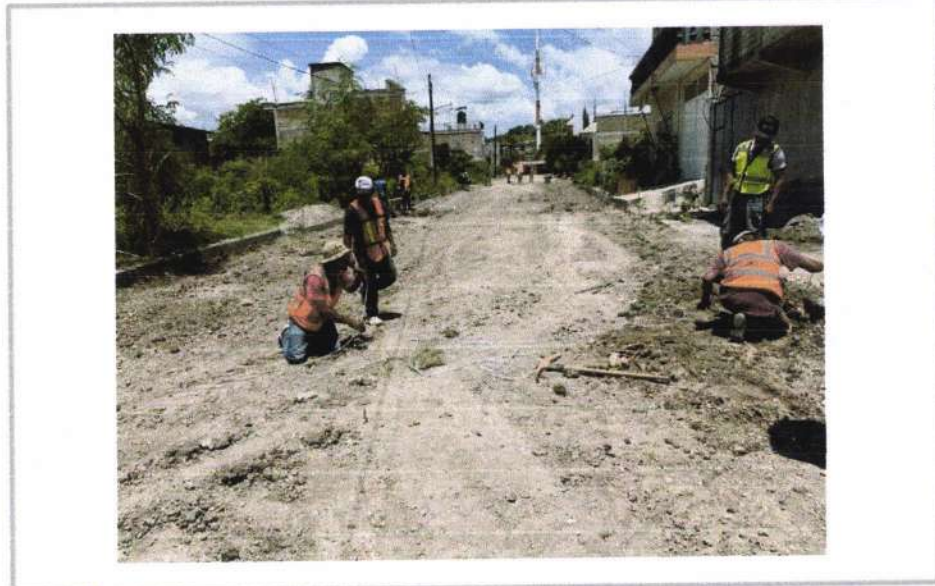
LIMPIEZA Y TRAZO EN EL AREA DE TRABAJO.