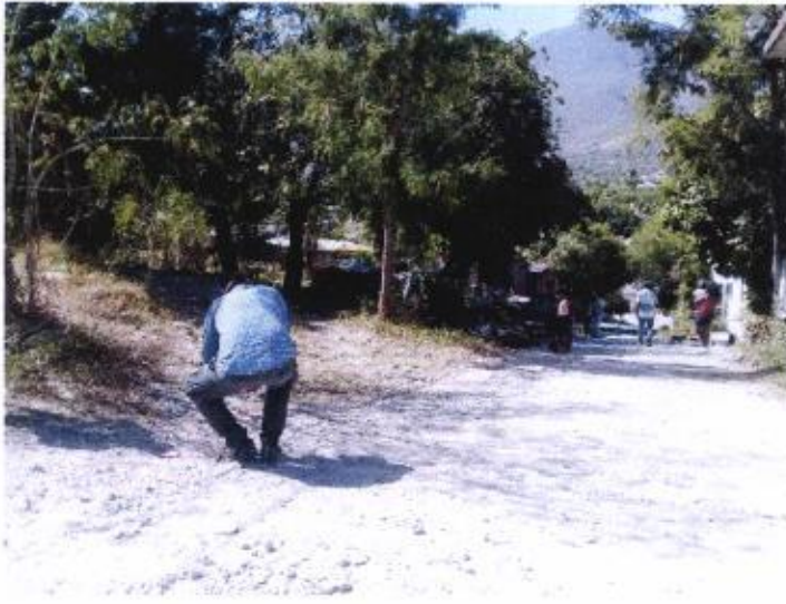
LIMPIEZA Y TRAZO EN EL AREA DE TRABAJO.

No. de CONTRATO: IGUALA/SDUOP/FISMDF/AYS/2020-60.