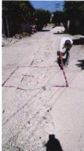
LIMPIEZA Y TRAZO EN EL AREA DE TRABAJO.

AYUNTAMIENTO MUNICIPAL MUNICIPAL DE IGUALA, GRO. EJECUCIÓN DE OBRAS PUBLICAS 2018 - 2021 TODOS JUNTOS HAREMOS HISTORIA